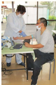
けつあつそくてい さいけつ さいいじやう かと 血圧測定と採血(35歳以上の方)