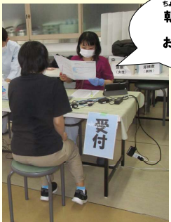
いし しんさつ 医師による診察