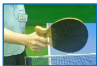
上肢に障がいのある方の ラケット