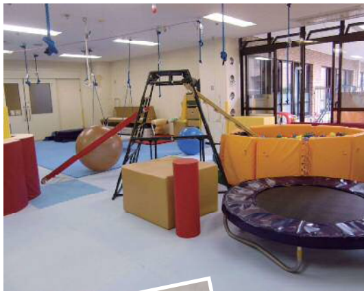
◀更生療育センター 作業療法室