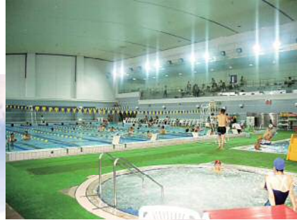
◀大阪府舞洲障がい者スポーツセンター