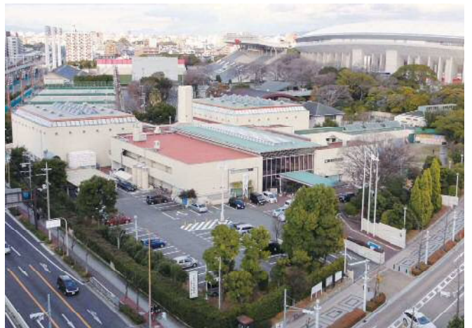
▼大阪市長居障がい者スポーツセンター