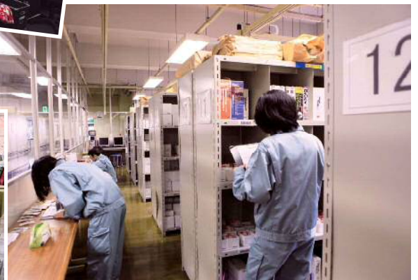
▲職業リハビリテーションセンター