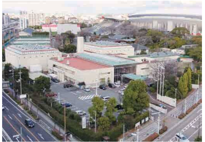
▼大阪市長居障がい者スポーツセンター