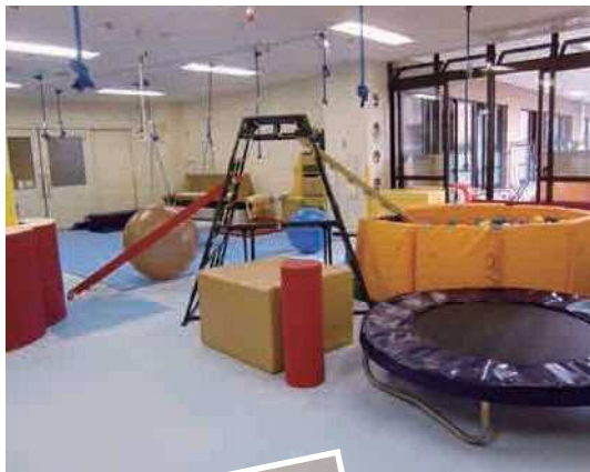
◀更生療育センター 作業療法室