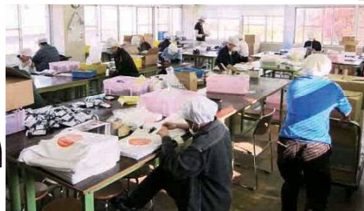
◀ 中津サテライトオフィス