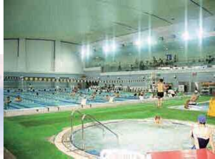
◀大阪府舞洲障がい者スポーツセンター