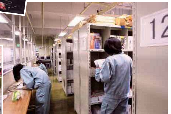
▲ 職業リハビリテーションセンター