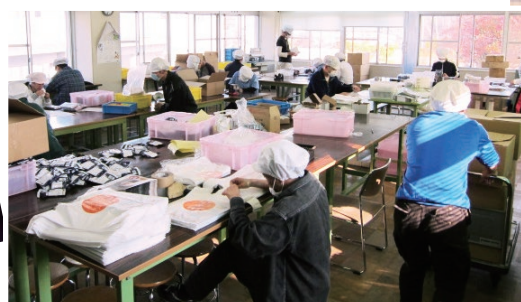
◀ 中津サテライトオフィス