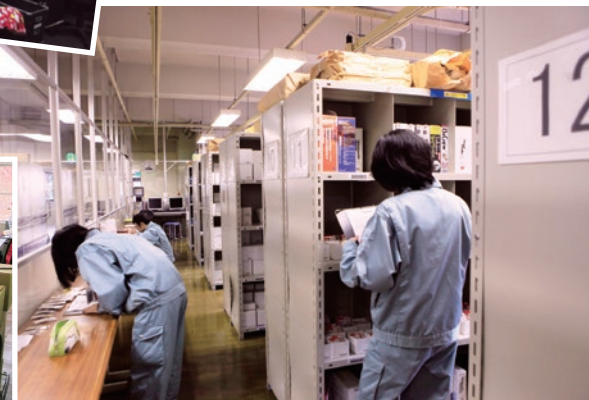
▲ 職業リハビリテーションセンター 職業指導センター ▼