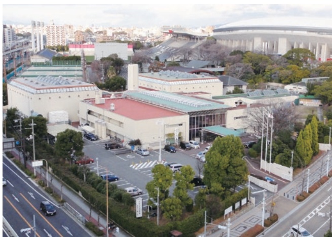
▼大阪市長居障がい者スポーツセンター