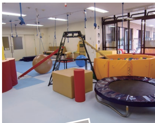
◀更生療育センター 作業療法室