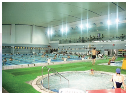
◀大阪府舞洲障がい者スポーツセンター